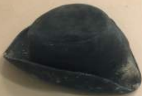
Design de NUNO BALTAZAR Chapéu Preto