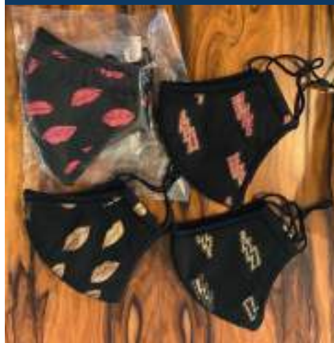
Design de NUNO BALTAZAR 12 Máscaras em Tecido e Sacos para Óculos