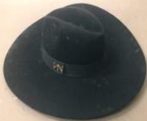
Design de NUNO BALTAZAR Chapéu Panama Preto