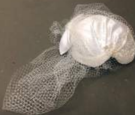
Design de NUNO BALTAZAR 3 Chapéus de Cerimónia com Véu