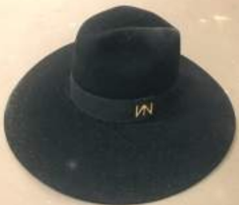
Design de NUNO BALTAZAR Chapéu Preto