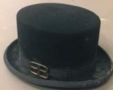
Design de NUNO BALTAZAR Chapéu Cartola Preto