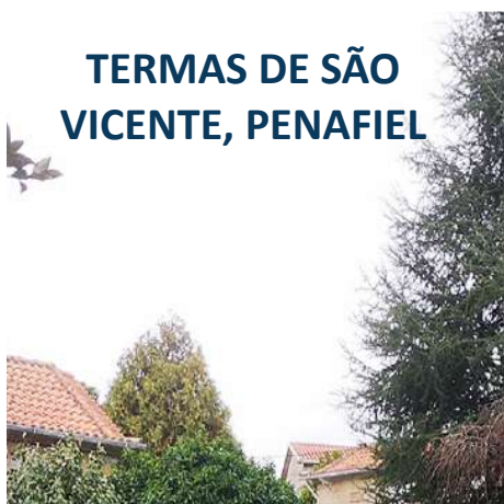
TERMAS DE SÃO VICENTE, PENAFIEL